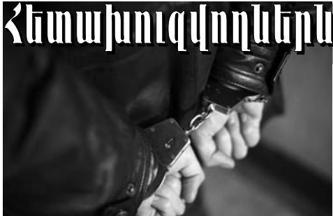
Սկիզբը՝ էջ 1

Կոտայքի մարզի ընդհանուր իրավասության դատարանում Սուրբատ Ա.-ն իրեն մեղավոր չի ճանաչել: Նա հայտնել է, թե կնոջ հետ մեկնել է Ռուսաստան, որտեղ բնակվել ու աշխատել է կնոջ ծնողների ու եղբոր՝ Ռուդիկի հետ: Ընդհանուր վաստակած գումարից տուն են գնել աներոջ ընտանիքի համար: Ռուդիկը հորը ստիպել է վաճառել այդ տունը, գումարը տալ իրեն: