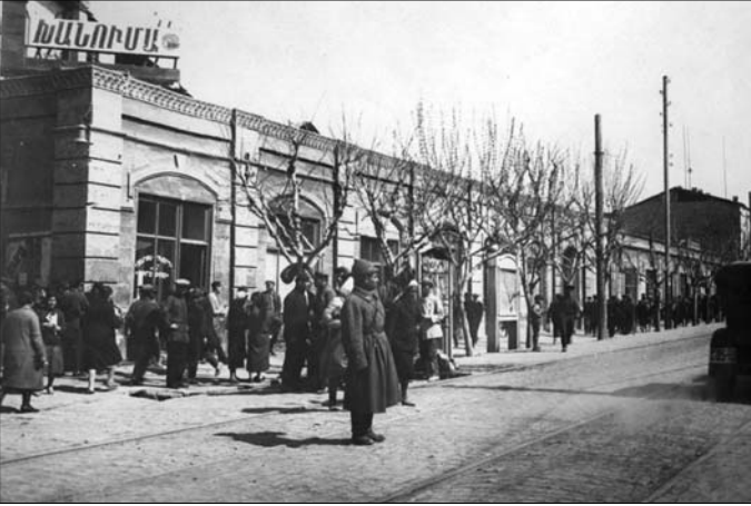
Միաժամանակ նախատեսվում էր Հայաստանի 14 զավառներում կազմակերպել միլիցիոներական 8-ամյա դասընթացներ:

Սեպտեմբերի 2-ին Կիլիկիայից ժամանած ֆրանսիական բանակի սպա, ռազմական ժանդարմական ստորաբաժան-