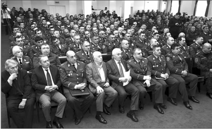
Սկզբը էջ 1

Խորհրդակցության մասնակիցների ուշադրությունը հրավիրվեց բնակարանային գողությունների բացահայտման ու կանխարգելիչ միջոցառումներ իրականացնելու խնդրին: Փորձը ցույց է տվել, որ շոգ եղանակներին ավելանում են տներից կատարվող գողությունները, բանի որ հանցագործները բնակարաններ են մտնում բաց դռներով կամ պատուհաններով: Այս առումով ոստիկանության պետը հանձնարարեց համայնքային ոստիկանությանը՝ կանխարգելիչ միջոցառումներ իրականացնել: Ընդհանուր առմամբ դրական գնահատելով ոստիկանների ծառայությունը՝ վաերի