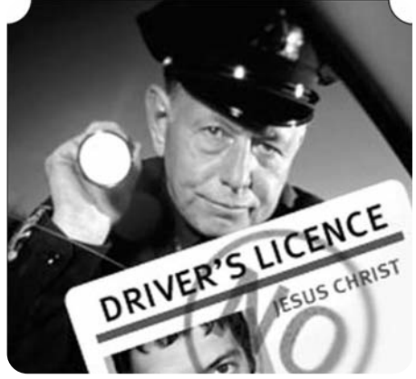
մարձակվեր փուզանել Հիսուս անունը կրողին: Ինչեւէ, նա անցած 15 փարիների ըն-

Դժվար է ասել, թե ինչն նրան ստիպեց Լավրոն որդու անունը կրել. ինքը պնդում է, որ հավաքեց ելնելով, սակայն շաբերի կարծիքով՝ արարքը շահադիպական նպատակ էր հետապնդում. դժվար է պարկերացնել մի ոստիկանի, որը կհաս