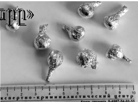
Թմրանյութ օգտագործող էր, մյուսը՝ իրացնող:

Ոստիկանության տարբեր ծառայությունների կողմից իրականացվող գիշերային շրջագայությունները կանխարգելիչ միջոցառումների տեսանկյունից, որպես կանոն, արդյունավետ են: Արդյունավետ էր նաեւ ոստիկանության պարեկապահակետային ծառայության եւ կենտրոնական բաժնի աշխատակիցների համատեղ գիշերային շրջայցը: