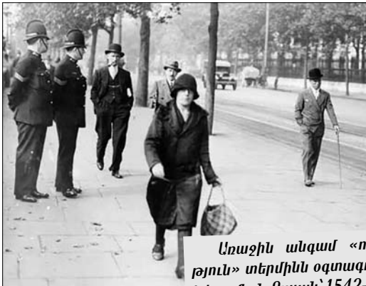
Առաջին անգամ «ոստիկանություն» տերմինն օգտագործել է Մելիսիր Ֆոն Օսսան՝ 1542-1545 թվականներին, երբ Սաքսոնիայի կյուրֆյուրստության կանցլեր էր: Եվ Մելիսիր Ֆոն Օսսայի, Եւ Նիկոլայ դը Լամարի համար, որը 1750 թվականին հրատարակեց «Տրակտատ ոստիկանության մասին» աշխատությունը, ոստիկանություն բառը ուներ «հասարակական կարգուկանոն» նշանակությունը:

Բրիտանիայում, հատկապես՝ Լոնդոնում, օրինականությունն ապահովելու առավել արդյունավետ միջոցներ եւ ուժեր ունենալու ցանկությամբ անհրաժեշտություն առականական կառույցը, իսկ ավելի ուշ՝ համանման կառույցներ սկսեցին գործել Կանադայում, Հնդկաստանում եւ Ավստրալիայում: ԱՄՆ-ում առաջին մշտական ոստիկանական դեպարտամենտը հիմնվել է 1845 թվականին՝ Նյու Յորքում, իսկ ավելի ուշ՝ նաեւ Բոսթոնում: Այս դեպարտամենտները լիովին ենթարկվում էին պետությանը, եւ դրանց գործունեությունը հստակ վերահսկվում էր: Ներկայումս Կանադայի տարածքում գործում է 800 ոստիկանական կազմավորում, որոնք գործառնություններով բավական մասն են Բրիտանիայի ոստիկանությանը: